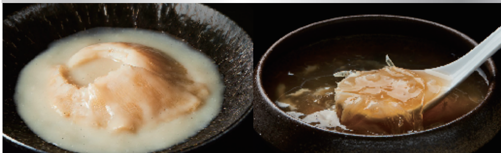
特選ふかひれ姿煮 (白湯スープ) 5,200 円