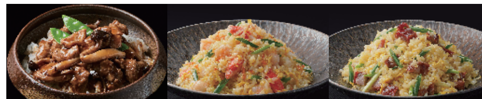
スペアリブ飯 1,200 円