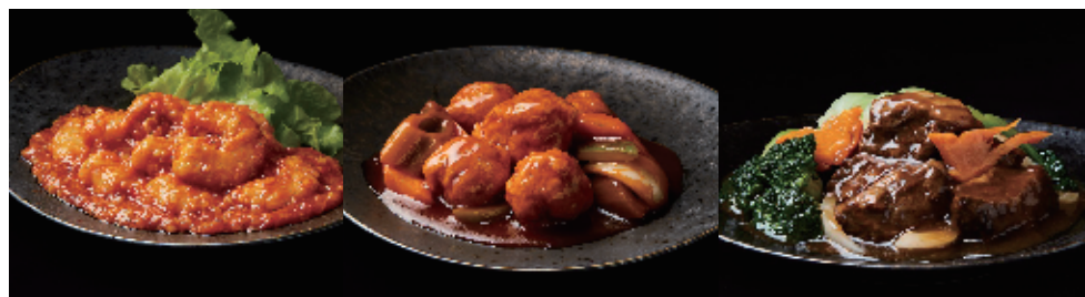
特選海老のチリソース 1,500 円