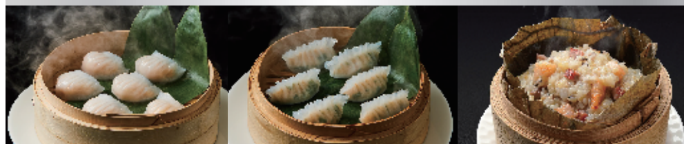
海老蒸し餃子 (6 個入) 1,100 円