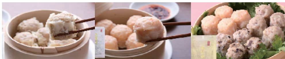
豚肉焼売 (8 個入) 1,100 円