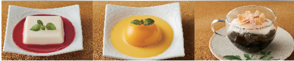
杏仁豆腐山桃ソース 340 円