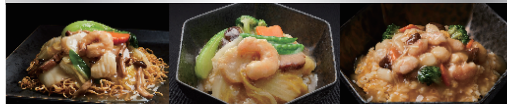
五目焼きそば 1,400 円