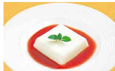
372 杏仁豆腐 山桃シロップ ¥660