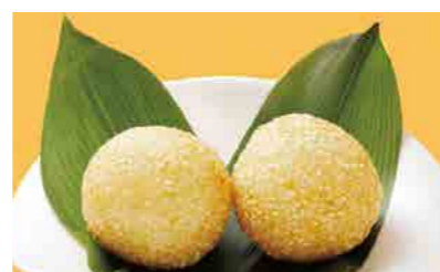
373 ゴマ団子 ¥580