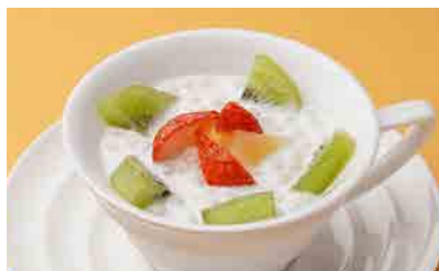
371 タピオカ入りココナッツミルク ¥550