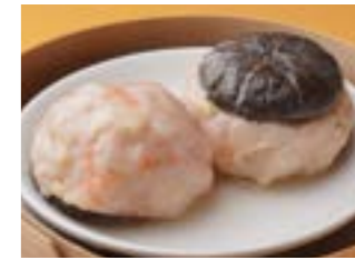
288 海老すり身椎茸重ね蒸し ¥800