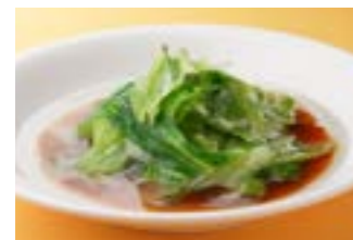
261 レタスの湯がき ¥600