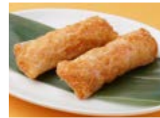
293 海老の紙包み揚げ ¥940