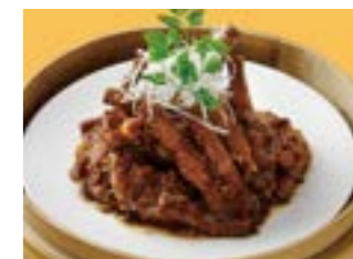
296 鶏足の黒豆ソース蒸し ¥920