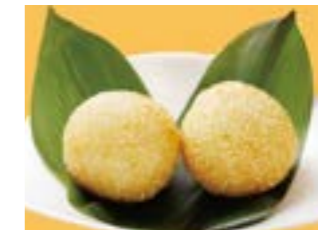
295 ゴマ団子 ¥700