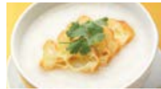
221 白粥 (Sサイズ)¥480 ¥700