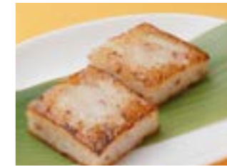
287 大根餅 ¥600