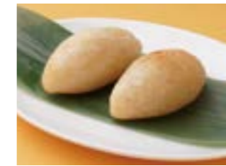
294 五目餅揚げ ¥660