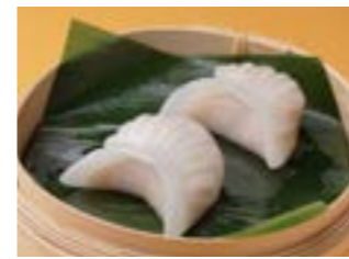
281 海老蒸し餃子 ¥520