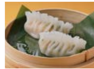
282 海老ニラ餃子 ¥540