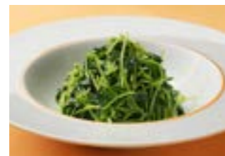
262 豆苗のニンニク炒め ¥800