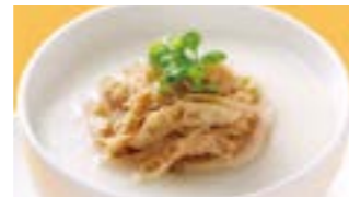
223 牛モツ粥 (Sサイズ)¥630 ¥900