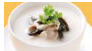
225 豚肉とピータン粥 (Sサイズ)¥840 ¥1,200