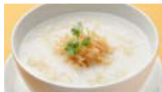
226 干し貝柱粥 (Sサイズ)¥840 ¥1,200