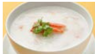
227 蟹肉粥 (Sサイズ)¥1,120 ¥1,600