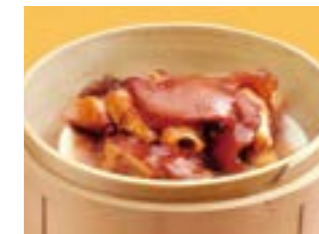
300 豚足蒸し ¥820