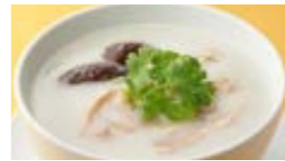
224 鶏粥 (Sサイズ)¥630 ¥900