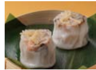
285 干し貝柱肉焼売 ¥900