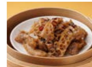
298 牛モツの黒豆ソース蒸し ¥900