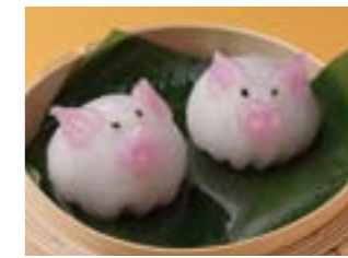
283 こぶた餃子 ¥840