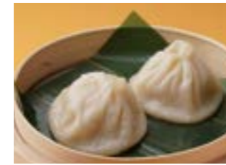
286 小籠包 ¥560