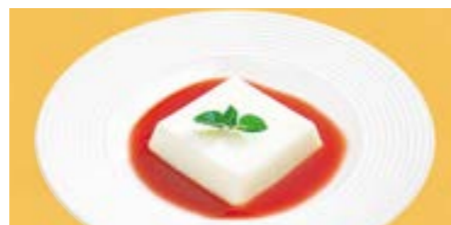
372 杏仁豆腐 山桃ソース ¥ 750