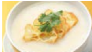
222 豆乳粥 (Sサイズ)¥480 ¥700