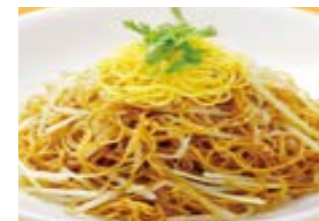
263 黄ニラ焼きそば ¥1,400