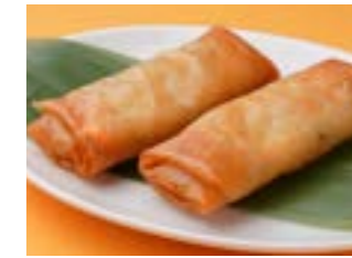
292 春巻 ¥760