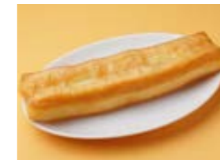
291 揚げパン (ユーツイアオ) ¥300