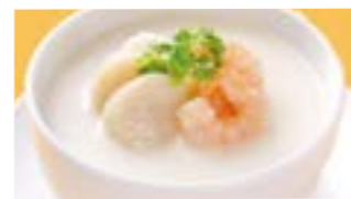
228 海鮮粥 (Sサイズ)¥1,250 ¥1,800