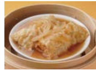
289 筍の湯葉巻き ¥960