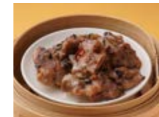
299 豚スペアリブの黒豆ソース蒸し ¥980