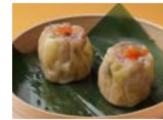
284 香港式海老焼売 ¥600