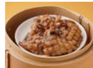
297 イカの黒豆ソース蒸し ¥1,300