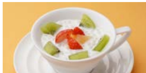
371 タピオカ入りココナッツミルク ¥ 700