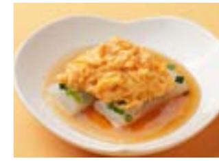
290 キシメン卵 ¥450